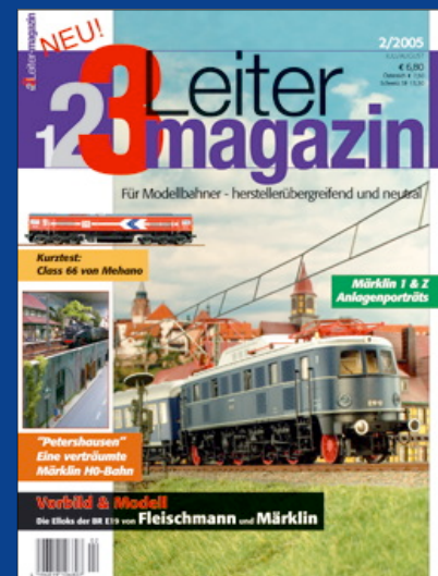
Titelbild. Modell der E-Lok BR E 19 von Fleischmann auf großer Fahrt.

Leider hat der Fehlerteufel auch vor unserer ersten Ausgabe nicht Halt gemacht: Bei der Anlagenvorstellung „Bahnbetrieb auf drei Etagen“ kam es im Kasten „Licht in die Wagen“ zu einem bedauerlichen Übertragungsfehler: Der digitale Funktionsdecoder von Märklin hat die Artikelnummer 60960 (und nicht 60966, wie irrtümlich angegeben) und die als Ersatzteil lieferbaren zweipoligen Spezialkupplungen kann man nur unter den Nummern 219446 und 219447 beziehen (nicht # 7319). Und schließlich verfügen die Zugschlusslaternen mit ihren roten Leuchtdioden über die Ersatzteilnummer 309980. Wir bitten die Falschinformation zu entschuldigen.